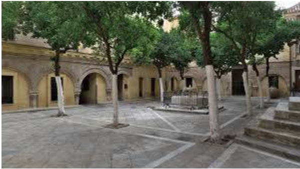
The Almohad mosque of Ibn Adabbas. Video by Elisa Simon