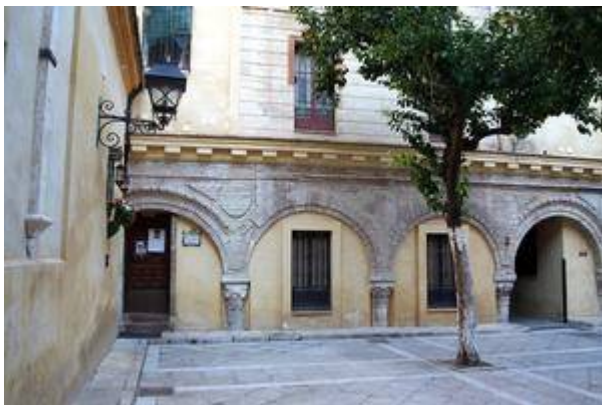
Patio de los Naranjos. Church of San Salvador