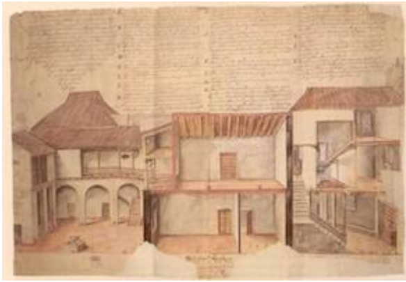
Interior of the public prison of Seville (South). Madrid. Archivo Histórico Nacional