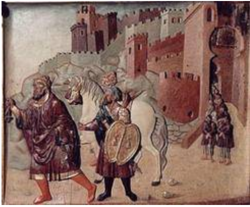
Boabdil handing the keys of the city. Altarpiece's predella of the Capilla Real of Granada. Felipe Vigarny (1520-1522)