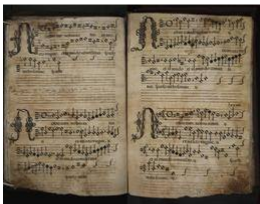
Pange lingua . [Francisco Guerrero]. Archivo de la catedral de Sevilla. Subfondo capilla de música, Libro de polifonía nº 2 [E-Sc 2], fols. 48v-49r