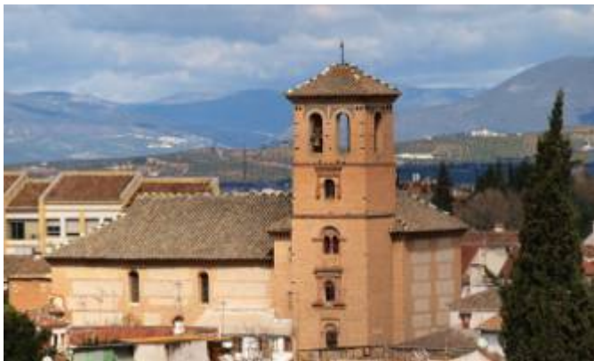
Church of San Bartolomé