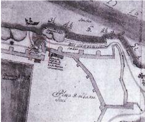
The Blanquillo (al sitio del Patín). Pedro Juan de Laviesca (1743)

https://www.youtube.com/embed/rpsJJDBekGI?iv_load_policy=3&fs=1&origin=https://www.historicalsoundscapes.com