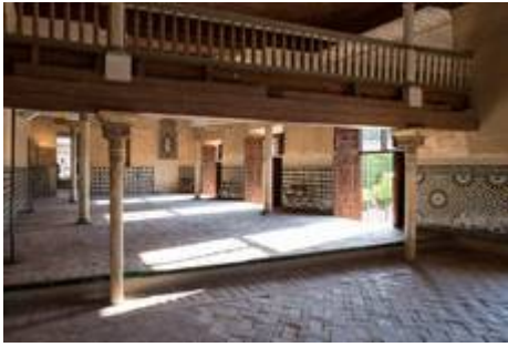
The Mexuar and the Oratory in the Alhambra