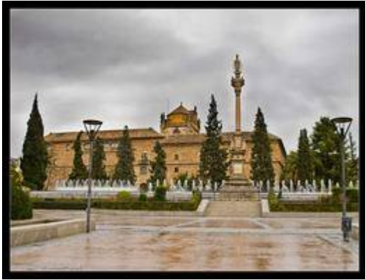
Jardines del Triunfo.