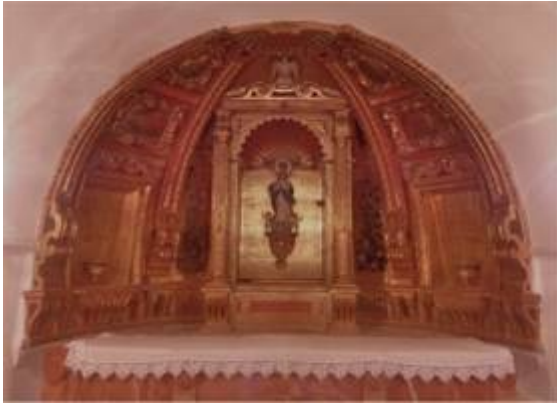
Altar of la Concepción (1). Church of Santiago. Collegiate church of el Sacromonte.