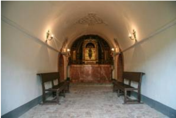
Altar of la Concepción (2). Church of Santiago. Collegiate church of el Sacromonte.