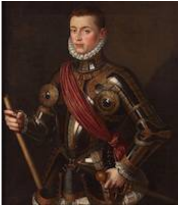
ohn of Austria in armour. Alonso Sánchez Coello (1567)