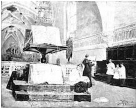
La Real Capilla de Granada. (Grabado de A. Bernal Rubio, publicado en la Exposición de Granada.)