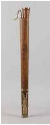
Dulzian (17th. century)