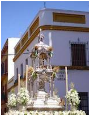
The Monstrance of the Corpus Christi procession in Trianal (1712-1716).