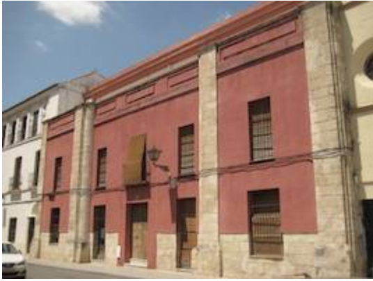
Old college of Las Becas.