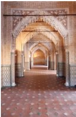
Sala de los Reyes. Alhambra