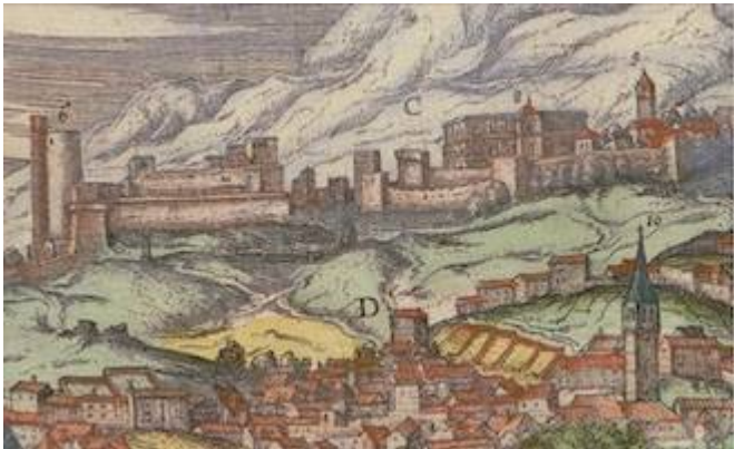
Church of Santa María de la Alhambra [9]. Joris Hoefnagel (1565)