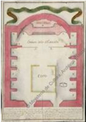
Planta de la Iglesia mayor de Orán (1734)