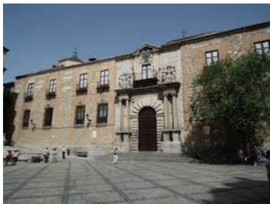
Fachada principal del palacio arzobispal