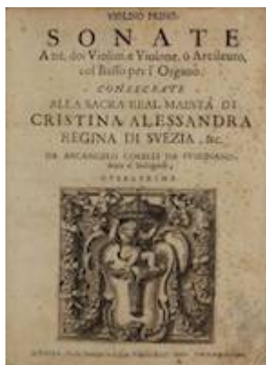
Edición de las Sonatas op. 1 de Corelli de 1681