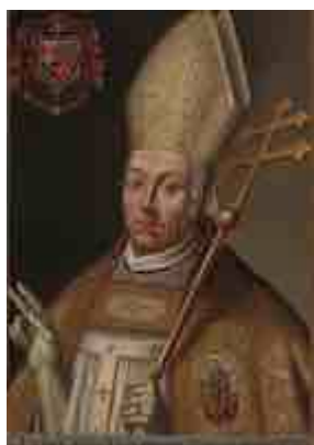
Retrato del cardenal Portocarrero en la sala capitular de la catedral de Toledo