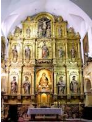
Retablo de la iglesia de San Andrés (Baeza)