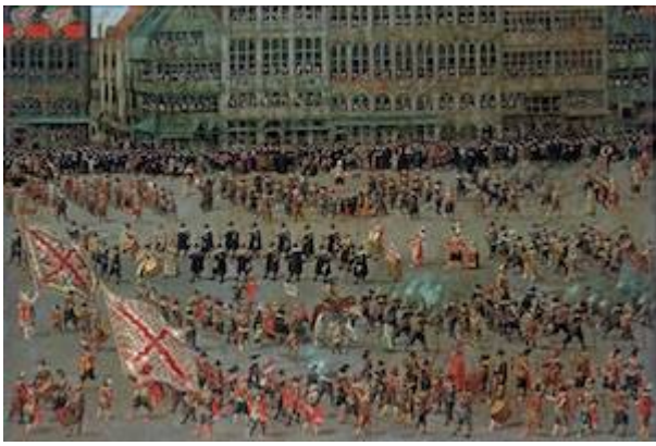
Desfile de los serments (1). Denys van Alsloot (1615)