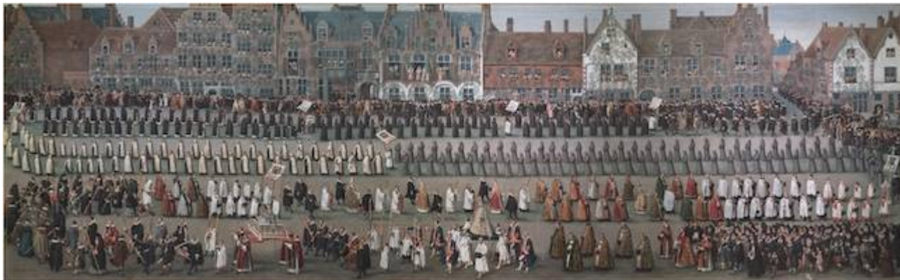
Procesión de Nuestra Señora del Sablón. Denis van Alsloot (1616)