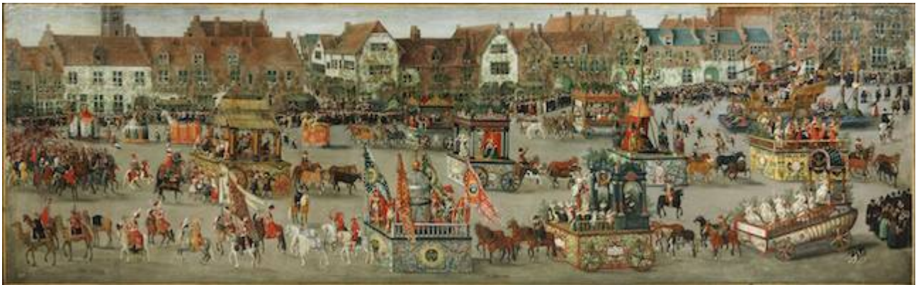
El triunfo de Isabel. Denis van Alsloot (1616)