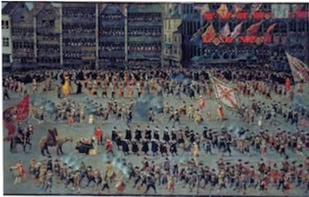
Desfile de los serments (2). Denys van Alsloot (1615)