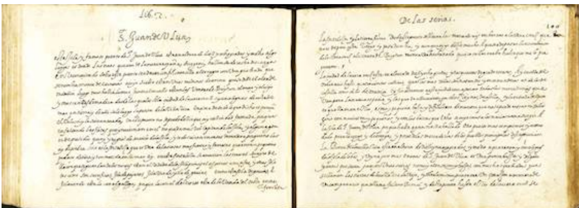
San Juan de Ulúa. Luz de navegantes , fol. 99v-100r. Baltasar Vellerino de Villalobos (1592)