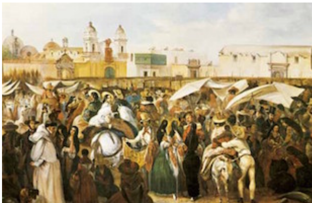
plaza de la Inquisición