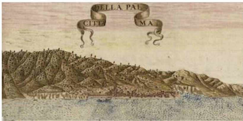
Descrittione et historia del regno de l'isole Canarie gia dette le Fortvnate. Leonardo Torriani. Biblioteca da Universidade de Coimbra, ms. 314, fol. 98r