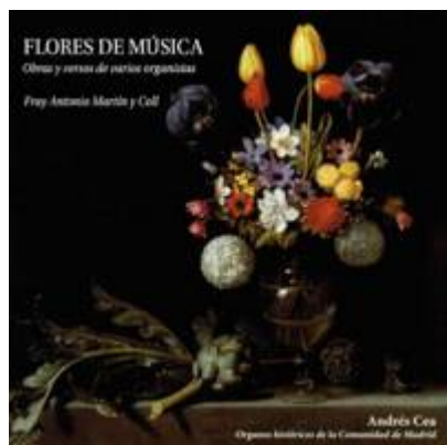
Ligaduras para la Elevación . Anónimo. Flores de Música. Obras y versos de varios organistas . Fray Antonio Martín y Coll. Organista: Andrés Cea. Sevilla, Lindoro, 2011

https://www.historicalsoundscapes.com/recursos/60/5/ligaduras-elevacion.mp3