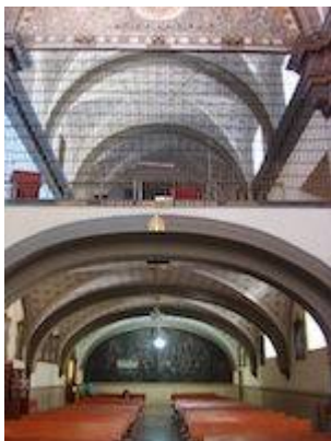
Coro del convento de la Santísima Trinidad