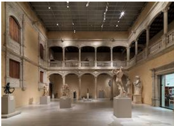
Patio del castillo de Vélez Blanco (1506-1515). Metropolitan Museum