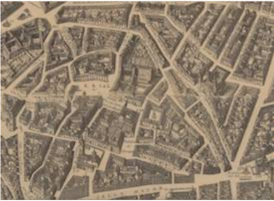
convento de las Descalzas Reales. Plano de Pedro Texeira (1656)