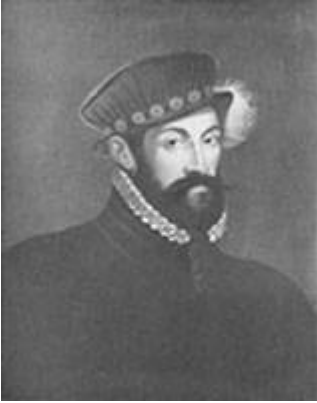
Juan de Borja