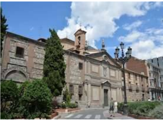
Monasterio de las Descalzas Reales