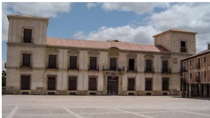
Palacio ducal de Medinaceli