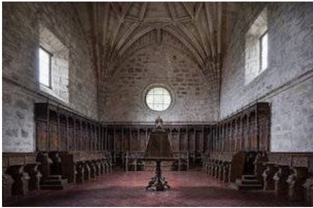
Coro del monasterio jerónimo de Yuste