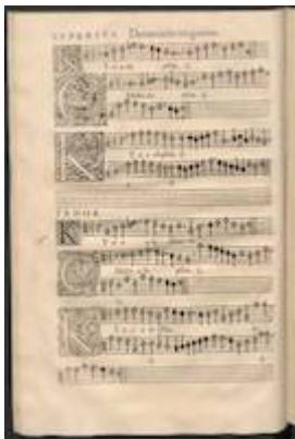
"Kyrie". Missa Dormendo un giorno . Francisco Guerrero. Liber primus missarum (París, 1566), fol. XCVv