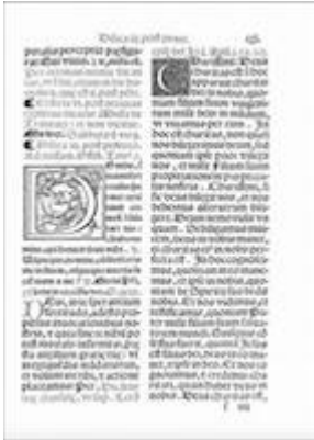
Missale... Hispalensis (Sevilla: Juan Gutiérrez, 1565), fol. cxl

https://embed.spotify.com/?uri=https://open.spotify.com/track/2ZgXkNyNPfV6HUVvGXoDD5?si=0b4bd0b38a03475a