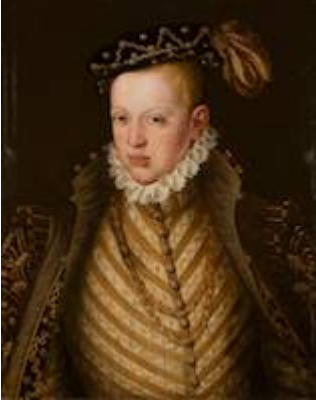
Retrato de Sebastián, rey de Portugal. Atribuido a Cristóvão de Morais (c. 1565)