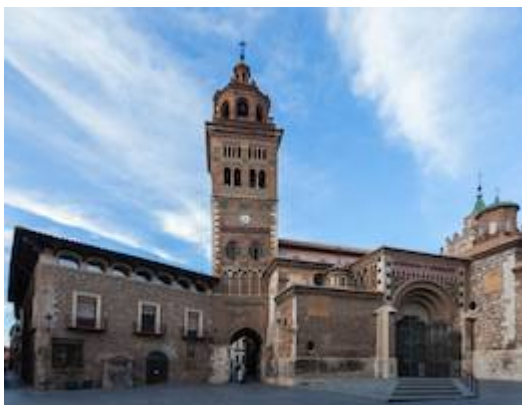
Catedral de Teruel