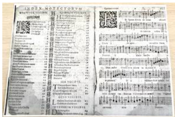
Index. Librete del Altus. Motecta (Venecia, 1597). Francisco Guerrero

https://www.youtube.com/embed/sZfDurkw-9A?iv_load_policy=3&fs=1&origin=https://www.historicalsoundscapes.com