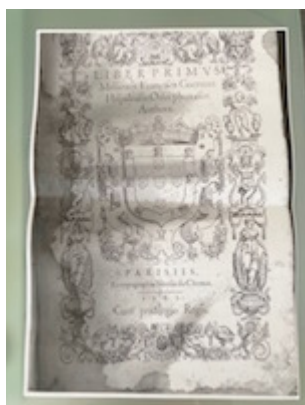
Portada. Liber primus missarum (París, 1565). [E-TE 01-002]