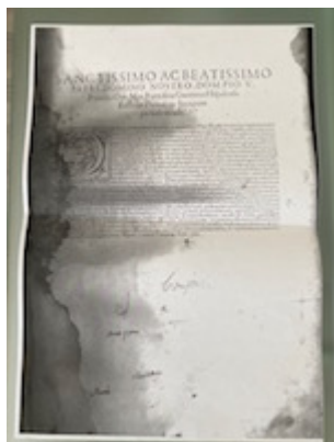
Dedicatoria al papa Pío V. Liber primus missarum (París, 1565). [E-TE 01-002]