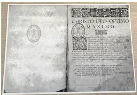
Dedicatoria. Librete del Altus. Motecta (Venecia, 1597). Francisco Guerrero