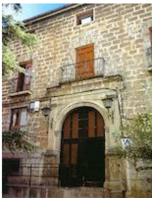
Convento de San Juan de la Penitencia en Cazorla (Jaén)