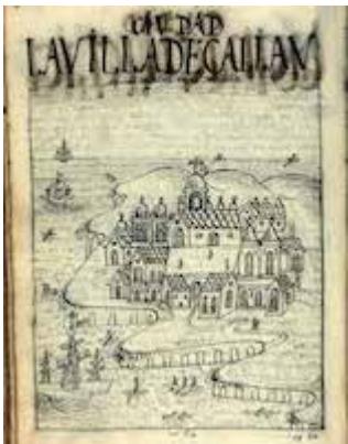
Ciudad la villa de Callau puerto de los Reyes de Lima. Felipe Guamán Poma de Ayala (1615)