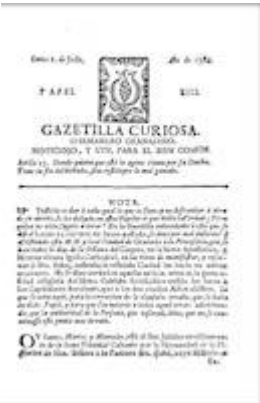
Gacetilla curiosa o Semanero granadino/em> del 2 de julio de 1764 (papel XIII)