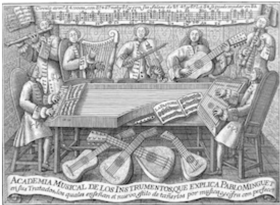
Pablo Minguet e Yrol. Reglas y advertencias generales que enseñan el modo de tañer todos los instrumentos mejores y mas usuales.... Madrid, 1754