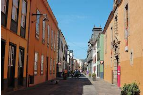
Calle Real de San Agustín