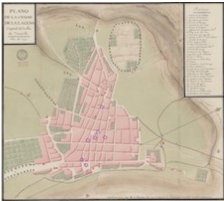
Plano de la ciudad de La Laguna (1779)