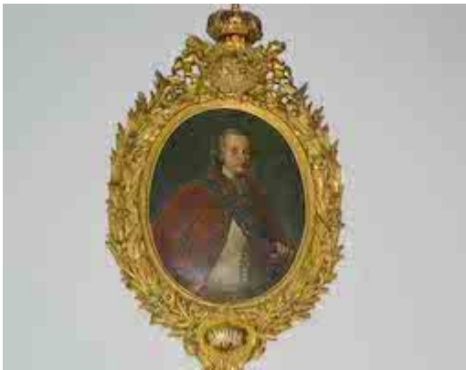
Retrato de Carlos IV. Félix Padrón (1789). Ayuntamiento de San Cristóbal de la Laguna