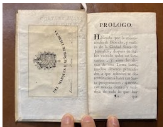
Breve tratado del viage que hizo a la ciudad Santa de Jerusalem . Francisco Guerrero. Real Academia de Bellas Artes de San Fernando (Madrid). Biblioteca, A-1792 (exlibris)