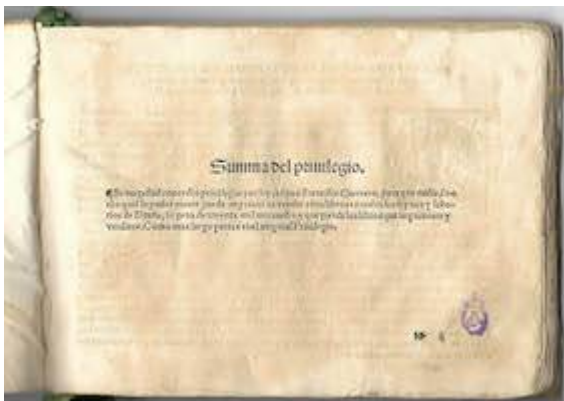
Sacrae cantiones . Francisco Guerrero. Privilegio impresión librete de tenor. Real Academia de Bellas Artes de San Fernando (Madrid). Biblioteca, A-2411-A-2415