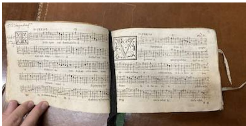
Sacrae cantiones . Francisco Guerrero. Anotación en librete Superior. Real Academia de Bellas Artes de San Fernando (Madrid). Biblioteca, A-2411-A-2415