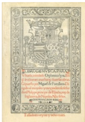
Orphenica lyra. Miguel de Fuenllana [E-Mba PA-2]