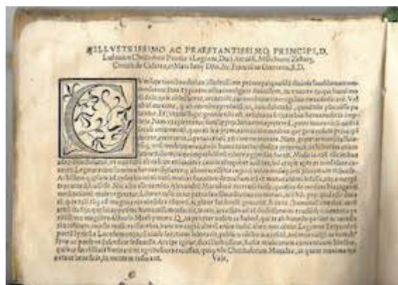
Sacrae cantiones . Francisco Guerrero. Dedicatoria librete de tenor. Real Academia de Bellas Artes de San Fernando (Madrid). Biblioteca, A-2411-A-2415