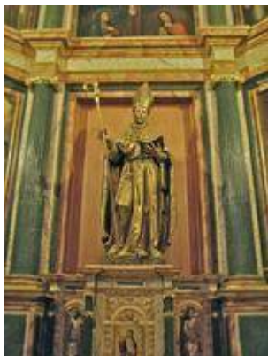
San Ildefonso (1603). Bernabé de Gaviria (escultor). Blas de Ledesma (pintor).