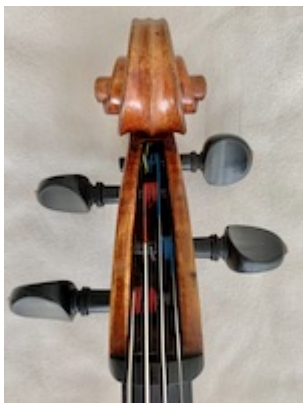
Voluta y clavijero. Violoncello (colección particular). Giovanni Maria Valenzano (Madrid: 1799).