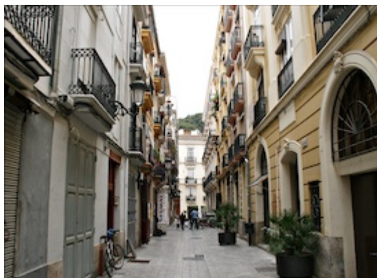
calle de los Zapateros