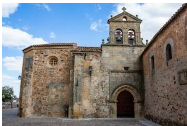
Convento de San Pablo