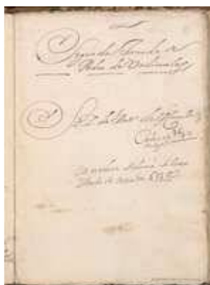
Anotación en el manuscrito de La gran comedia de Pedro de Urdemalas (fol. 25r)