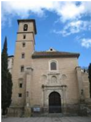
Iglesia de San Ildefonso.