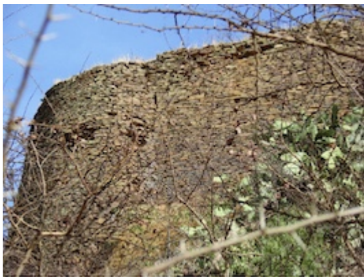
Restos de la fortaleza de Fremona (Adwa) –detalle-.