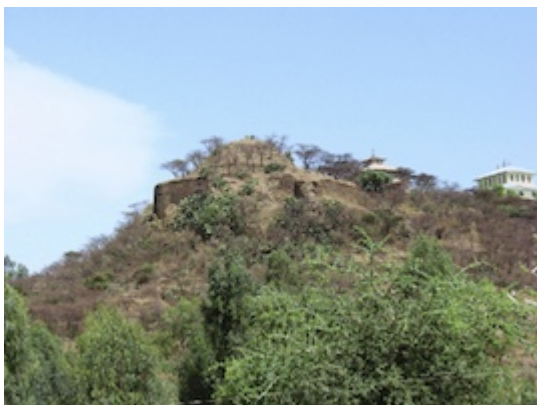
Restos de la fortaleza de Fremona (Adwa).