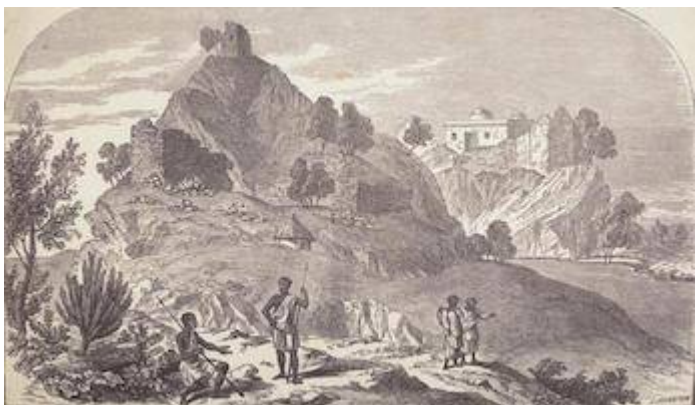
Vista de Fremona. J. Johnston