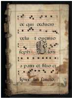
Biblioteca Nacional de España, MpCant/40, fols. IXr