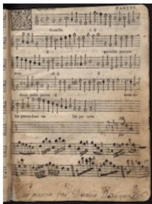
Missa Seculorum Amen. Francisco Guerrero. E-Bim 66, p. 70