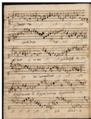
Salve regina . Francisco Guerrero. E-Bim 1, fol. 35v