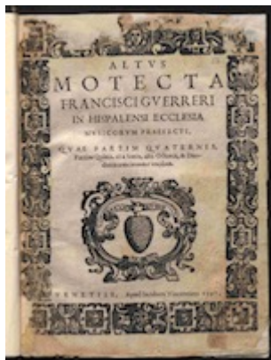
Portada librete Altus [E-Bim 67]