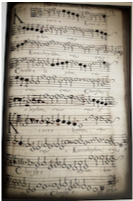
"Kyrie". Missa supra Sancta Maria succurre miseris. Petrus Fernández Buch, fol. 78r

"https://embed.spotify.com/?uri=https://open.spotify.com/track/4uQMYZxkUcaxMRN0G7jlah"