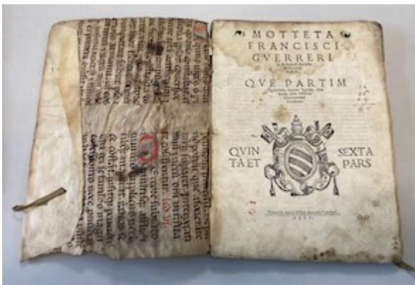
Motteta . E-V Impreso VIII [97]