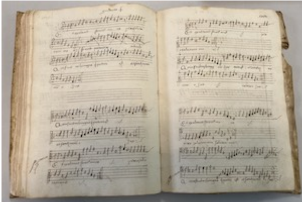
"Et exultavit". Magnificat I toni. E-V 5, fols. 124v-125r