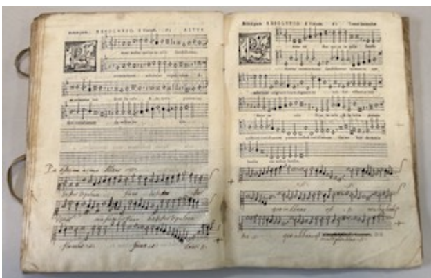
Motteta . E-V Impreso VIII [97]. Altus, 61