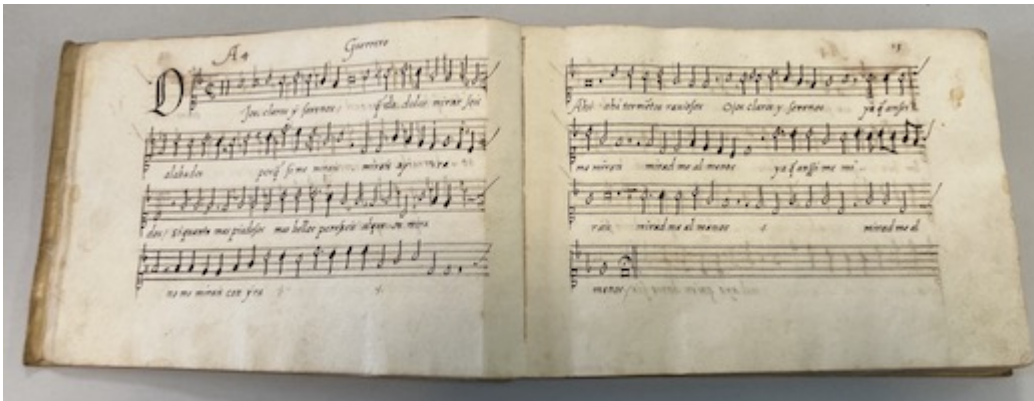
Ojos claros y serenos. Francisco Guerrero. E-V 17, fols. 12v-13r

https://embed.spotify.com/?uri=https://open.spotify.com/intl-es/track/7sJMMr8oaAsgzu4OXaWY2m?si=cf1cae609b234c80