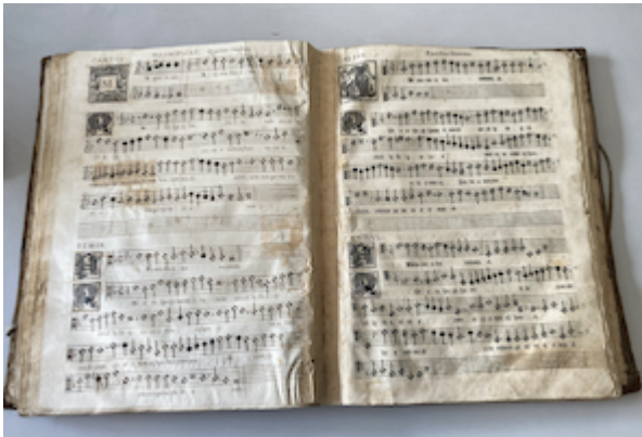
Liber vesperarum . E-V Impreso 2[2], fols. 86v-87r