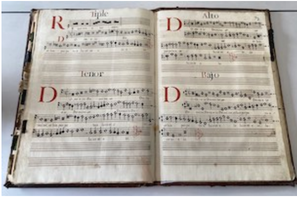
Missa pro defunctis. Francisco Guerrero. E-V 1, fols. 71v-72r