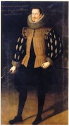
Retrato de Ruy Gómez de Silva Mendoza, III duque de Pastrana. Bartolomé González Serrano (1564-1627)

"https://embed.spotify.com/?uri=https://open.spotify.com/track/2Q2SJ2wO1uBz1LGHN89RDe