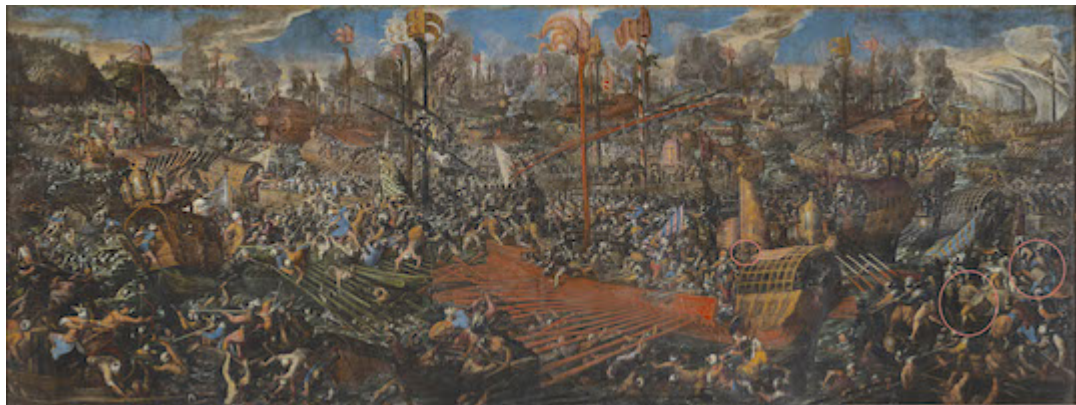
Batalla de Lepanto. Andrea Vicentino (1580)