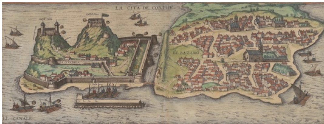
Puerto de Corfú. Civitas orbis terrarum , vol. 2 (1575)