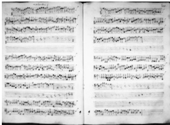
O invidia, nemica di virtute a 5. Orlando di Lasso. [E-Grmf 975]