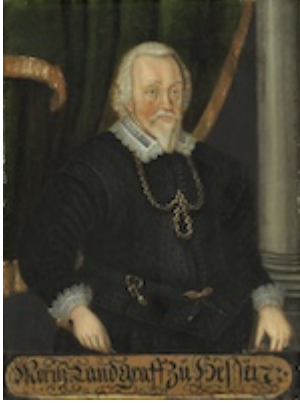
Moritz of Hesse-Kassel. Anónimo (siglo XVII)