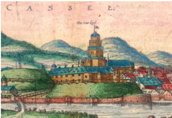
Castillo de los landgraves de Hesse-Kassel. Brown & Hogenberg (1572)