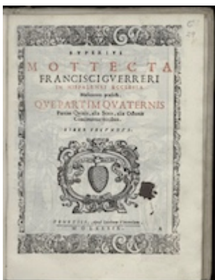
Superius. Mottecta . Francisco Guerrero (1589) [D-Kl 4° Mus. 1]