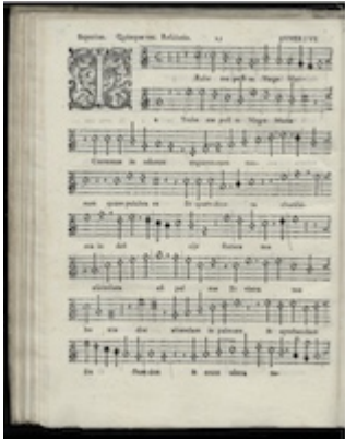
Superius. Trahe me poste . Francisco Guerrero (1589) [D-Kl 4° Mus. 1[1]